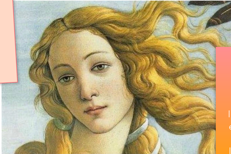
La naissance de Vénus, Sandro Botticelli

L'un des premiers courants psychothérapeutiques appartenant à l'approche humaniste a été développé par Carl Rogers, créateur de l'Approche centrée sur la personne.